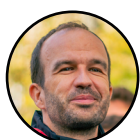
COORDINATEUR DE LA FRANCE INSOUMISE Manuel Bompard